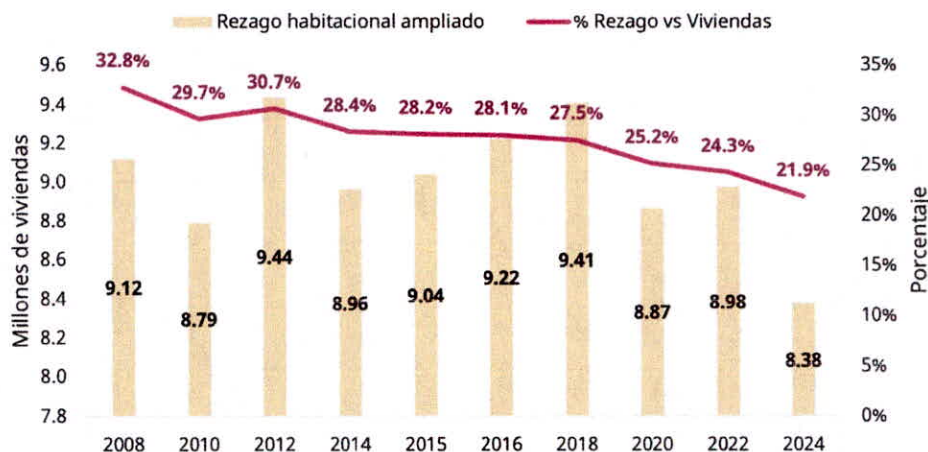
Gráfica 2. Rezago Habitacional Ampliado histórico, 2008-2024. (Millones de viviendas y porcentaje)

Por otro lado, según la Encuesta Nacional de Vivienda 6 , una proporción considerable de la población en el Estado, el 58%, es de viviendas particulares habitadas rentadas cuyo motivo principal de renta es “no tiene acceso a crédito o no tiene recursos”.